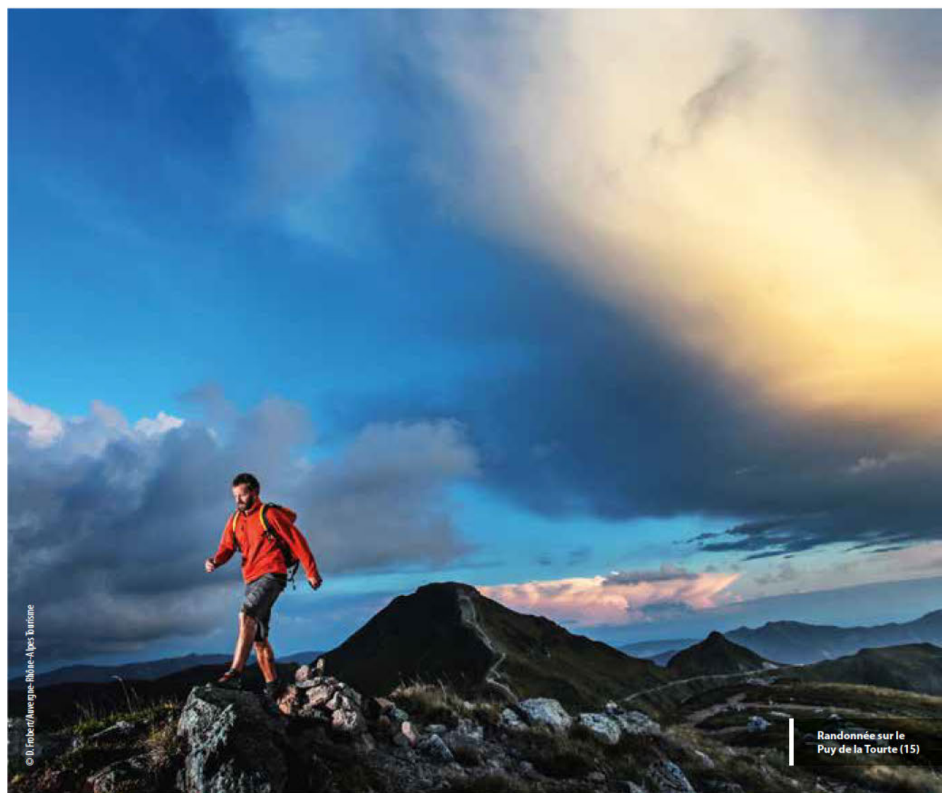
Randonnée sur le Puy de la Tourte (15)

CARTE TOURISTIQUE OUTDOOR / OUTDOOR TOURIST MAP