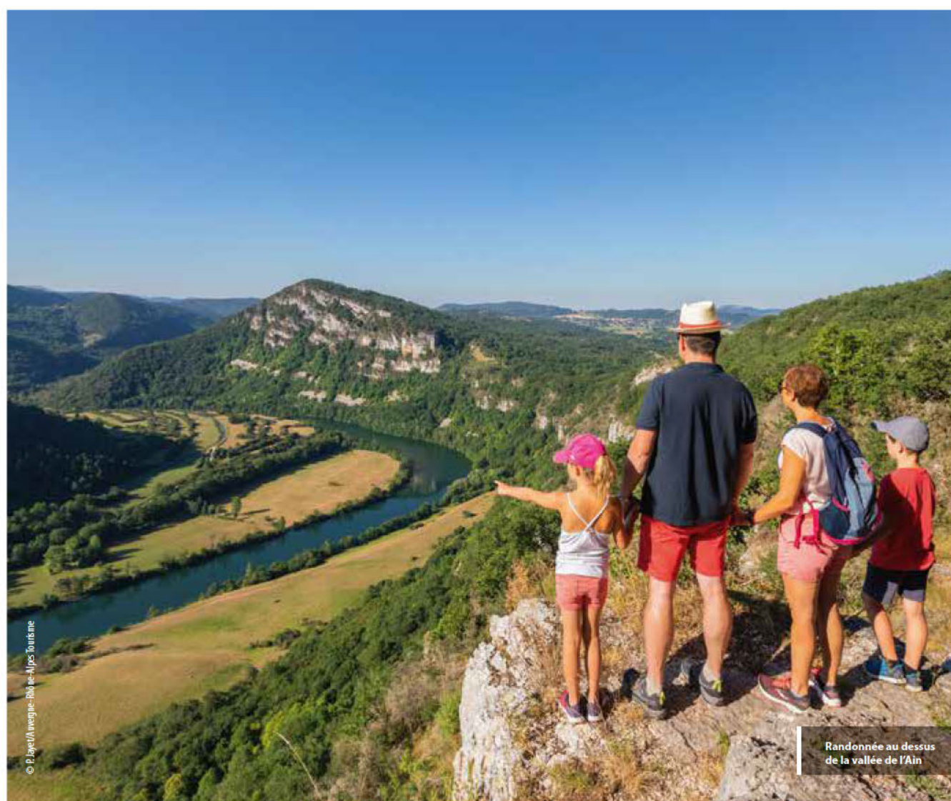
Randonnée au-dessus de la vallée de l'Ain