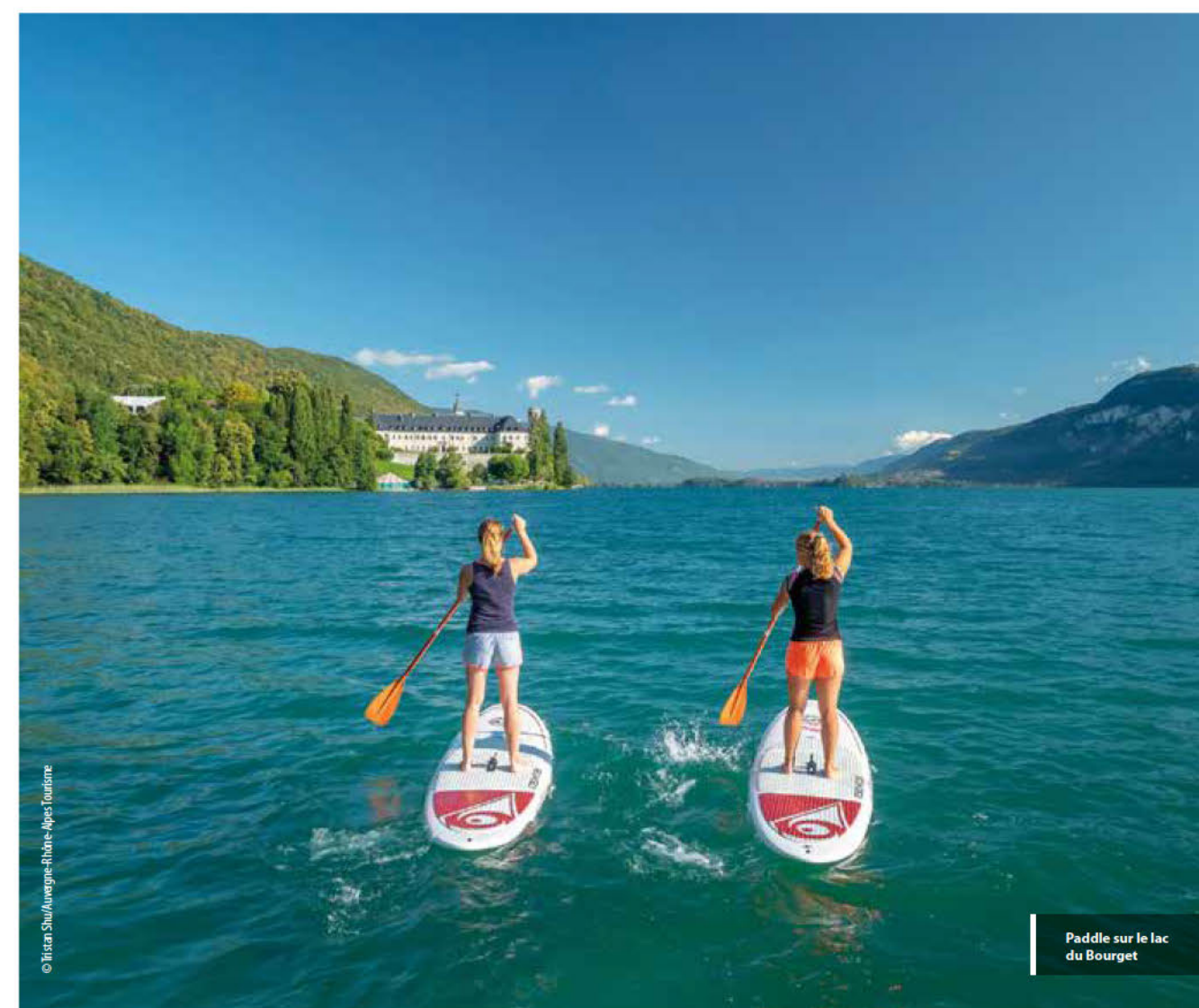
Paddle sur le lac du Bourget

En savoir + / More informations : www.kancelvelo.com/destinations/auvergne-rhone-alpes-a-velo