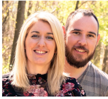
Le Caillou au Hiboux

« Ardéchoise et drômoise nous aimons photographier et découvrir nos deux départements sous toutes les coutures. Notre plus grand plaisir est de donner envie à nos lecteurs de sortir de chez eux en montrant que le voyage commence à deux pas de chez soi. Nous avons rejoint les éclaireurs car nous avons en commun les mêmes valeurs pour notre région et l'envie de les partager de façon responsable à travers nos textes et photos. « Partir ici » est un nouveau tremplin qui nous permet d'avoir plus de visibilité. Mais devenir éclaireurs, c'est avant tout faire partie d'une communauté qui lie les acteurs de l'écosystème touristique d'Auvergne Rhône-Alpes (ADT, prestataires, influenceurs, etc...) et qui dans le futur amènera sûrement à de belles rencontres pour promouvoir notre superbe région. Notre blog « Le Caillou aux Hiboux » a le même objectif, depuis 2017, nous partageons nos aventures, photos et expériences tout près de chez nous comme à l'autre bout du monde »