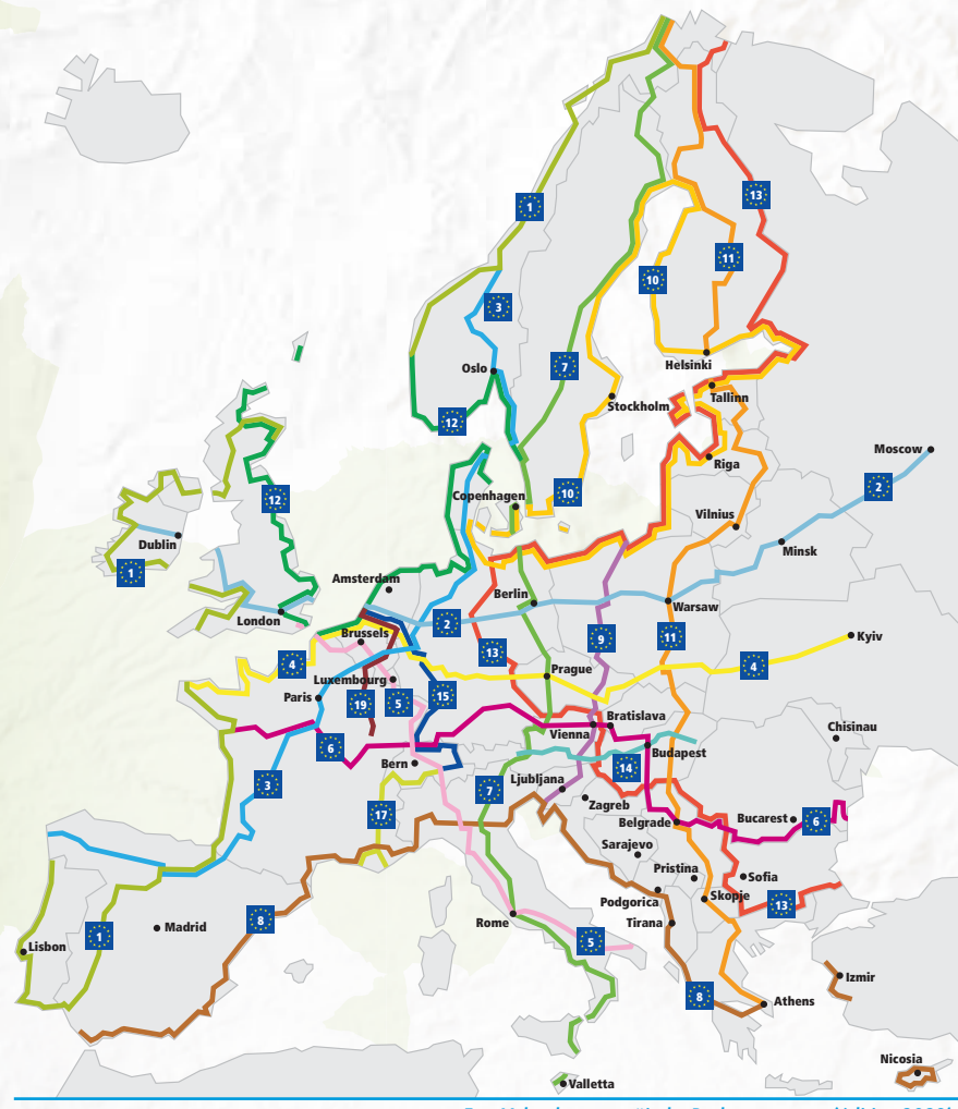
EuroVelo, das europäische Radwegenetz - (Edition 2023)